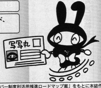
内閣官房「マイナンバー制度活用推進ロードマップ案」をもとに本誌作成